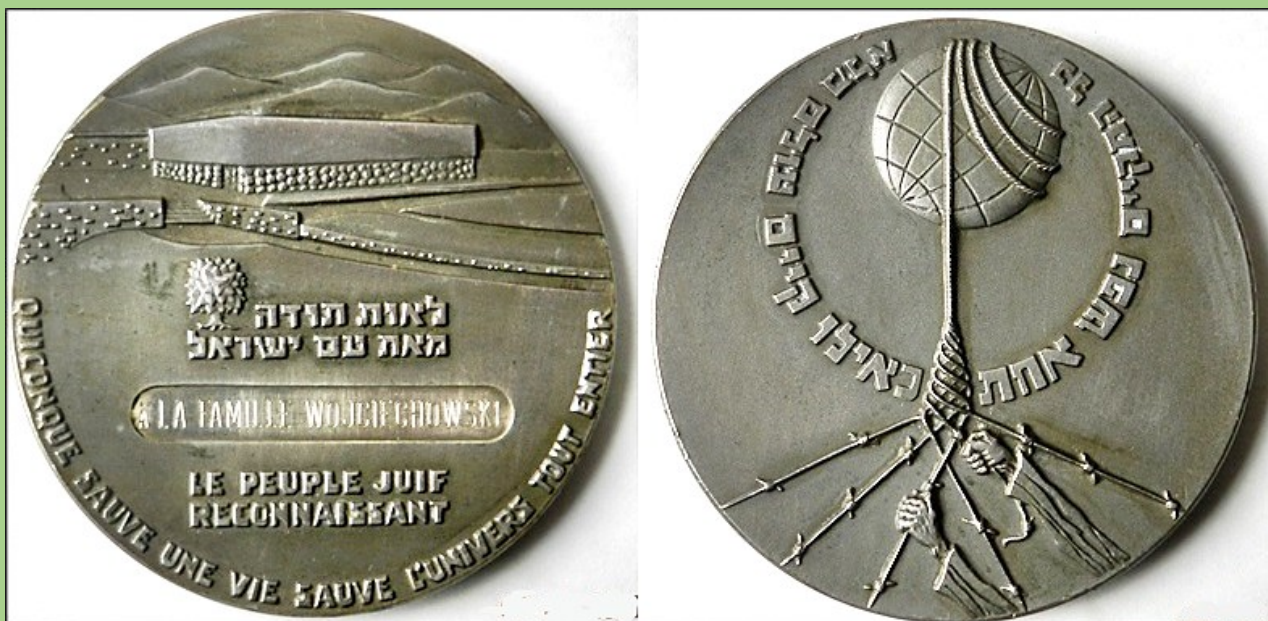
medal "SPRWIEDLIWI WŚRÓD NARODÓW ŚWIATA" dla Rodziny Wojciechowskich