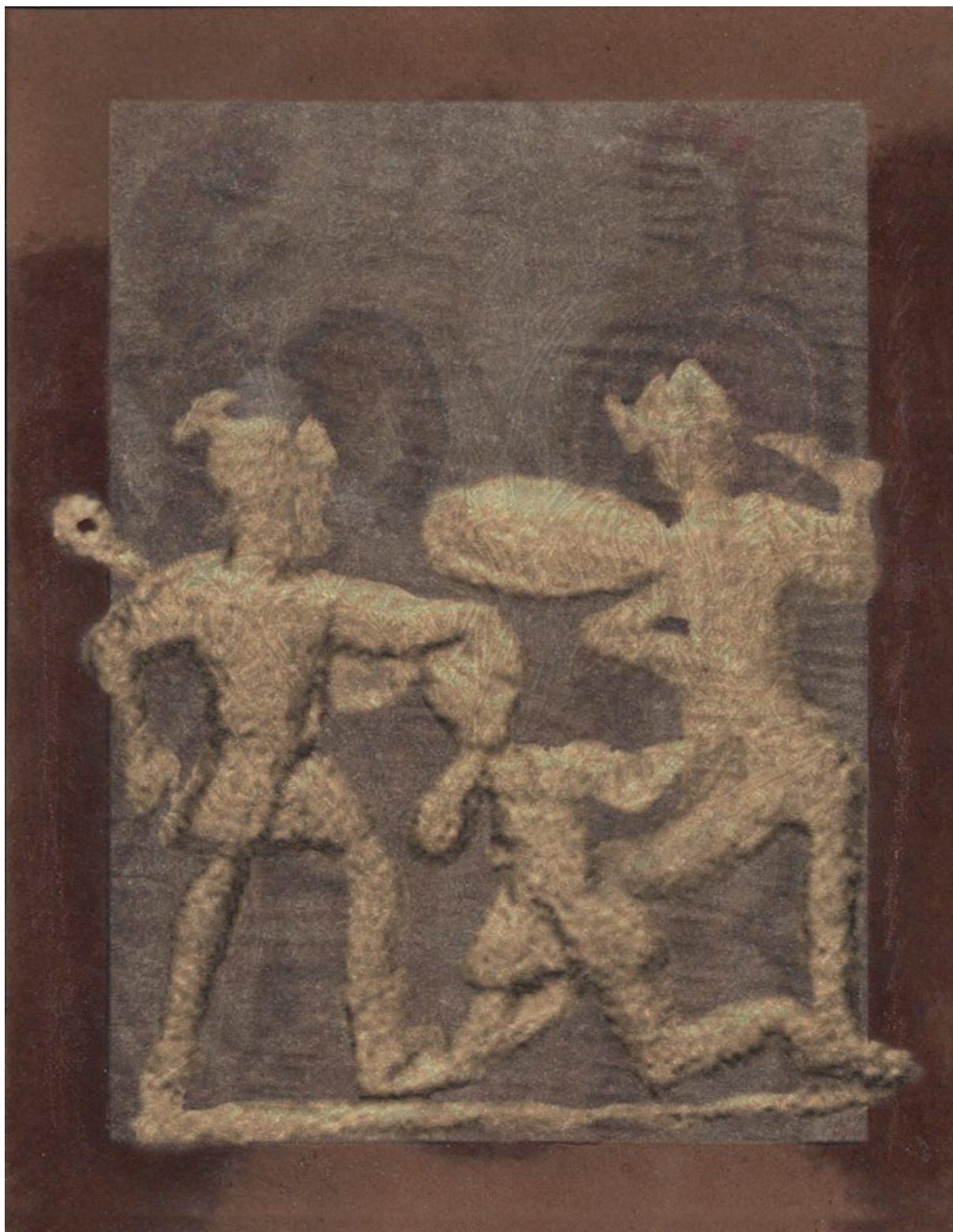
Pojedynek Hektora z Ajasem