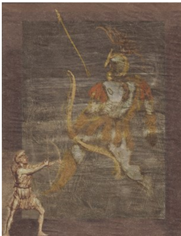
Parys z łukiem

Dla srogości najwięcej nienawidzę ciebie. Całyś wojną, niezgodą, mordami zajęty. Hery, jak widzę, matki, masz umysł niezgięty. Ledwie ją wstrzymać mogę, tak się klócić zwykła; Twoja boleść zapewne z jej rady wynikła. 900 Skróć twoje cierpienia, bom ojciec, bo z matki Twojej miłe mam w tobie ślubów z nią zadatki. Gdyby cię inny z bogów zrodził, za twe czyny W głębszych byś jęczał lochach niż Urana syny.” To wyrzekłszy, kazał go leczyć Pajonowi. Ten kroplą łagodzącą daje kres bólowi, Zamyka ranę jego balsamu moc dzielna, Bo nie była w Aresie natura śmiertelna. 905 A jako sok figowy prędko mleko ścina, Tak że się zaraz w bryłki gromadzić zaczyna, Tak szybko Ares zdrowy, bóg najzapalczywszy. Siostra zaś Hebe, w łaźni cieplej go obmywszy, Przybrała brata swego w najpiękniejsze stroje. Chlubny chwałą, przy ojcu zajął miejsce swoje. Odegnawszy Aresa od mężów pogromu, Wraca Hera i Pallas do Kronidy domu. 910 915 920