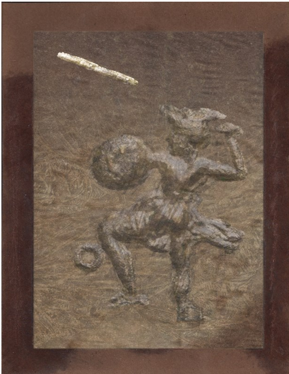
Agamemnon rzuca oszczepem