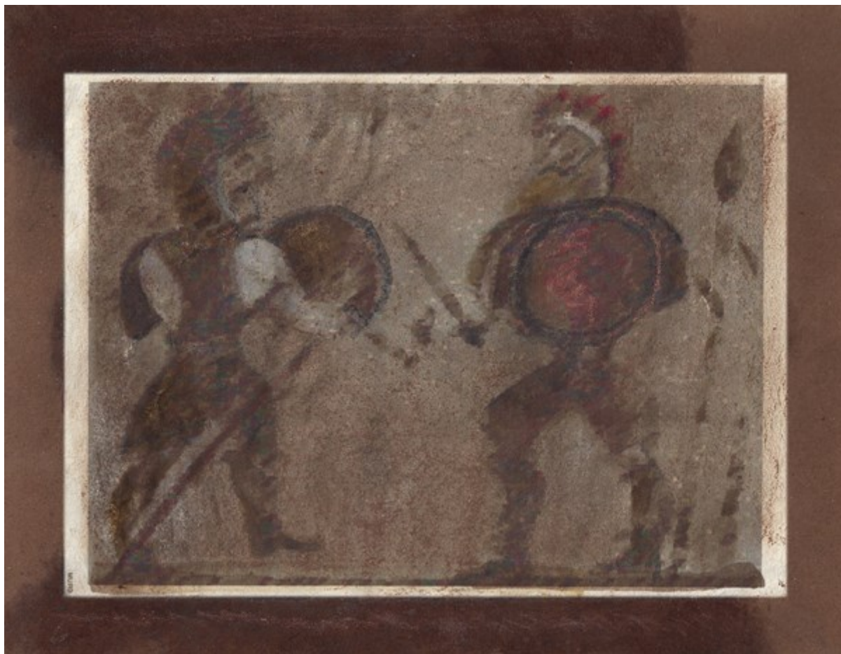
Hektor i Ajas