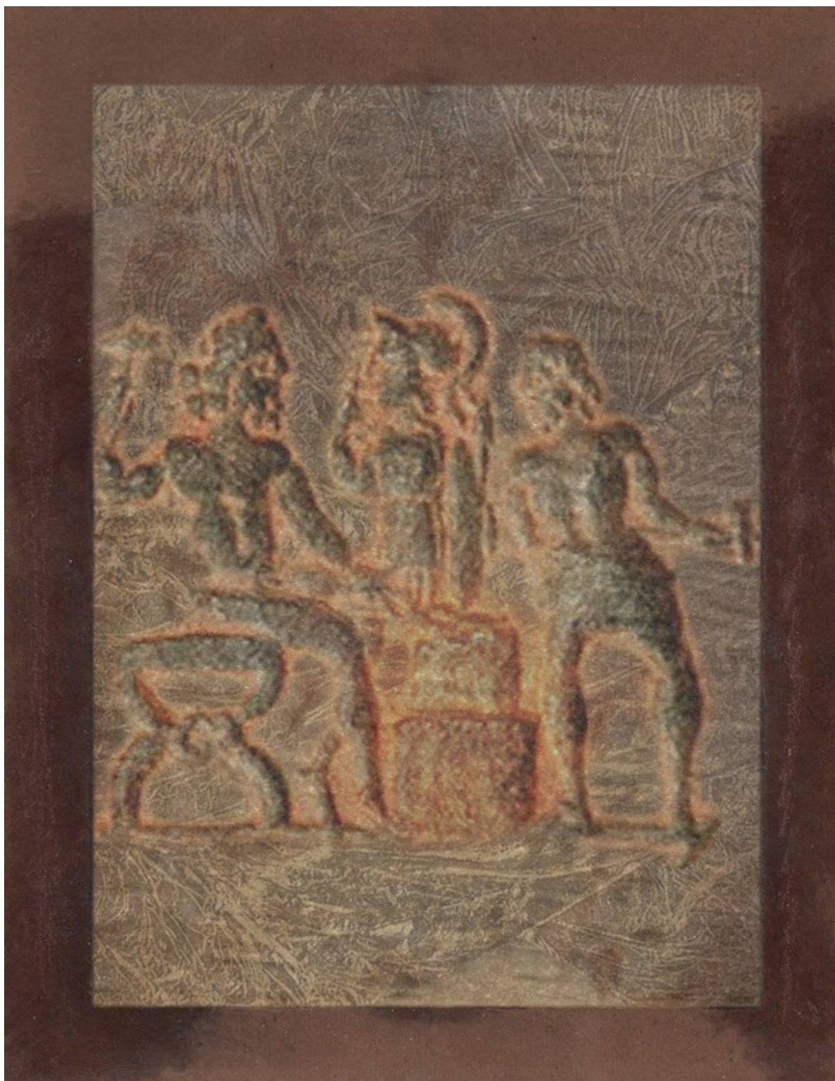
Hefajstos i tytani wykuwają zbroję dla Achillesa