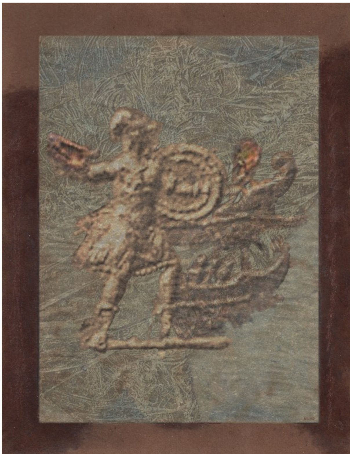
Hektor rzuca pochodnię w okręty Greków