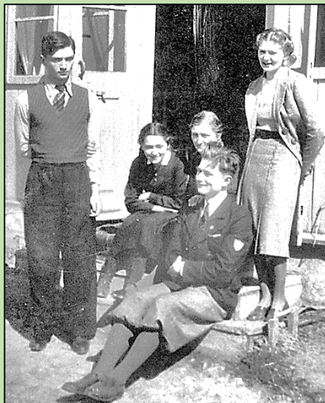
Powyżej - Brzezie; poniżej - Usarzów

Niewątpliwie ten czas mojego życia do II Wojny Światowej jest w mojej pamięci piękną, niczym nie zmaconą sielanką. W 1939 roku mieliśmy w sierpniu jechać nad morze do Orłowa. Tuż przed wyjazdem usłyszałem, jak ojciec powiedział głośno, że nie pojedziemy, bo psuje się pogoda. Sens i znaczenie tego zdania zrozumiałem oczywiście znacznie później.