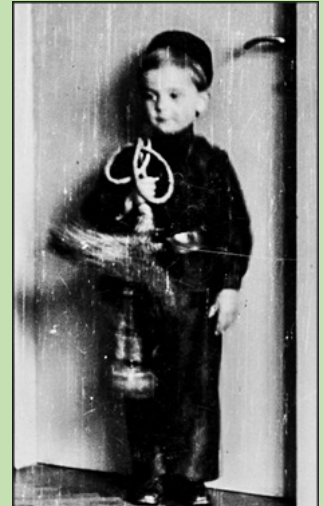
Autor wybiera się na bal przebierańców jako kominiarz. Karnawał 1938 r.