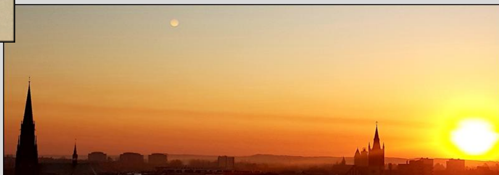
zdj. 2 w powiększeniu