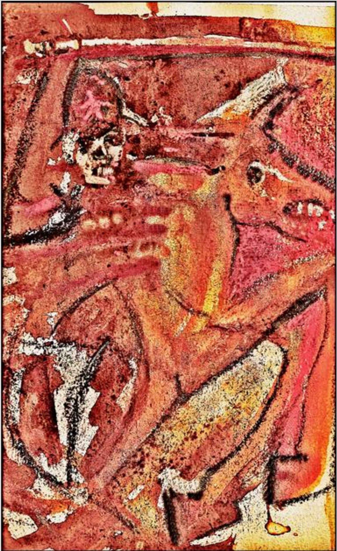
malował: mb (marzec 2022)