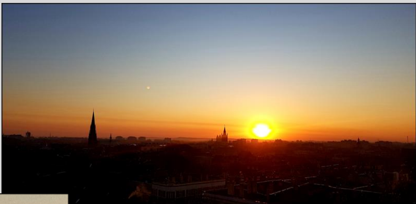
Bytom, 23.04.2020, g. 5:49 [w tym dniu księżyc w nowiu, czyli to nie księżyc – ]