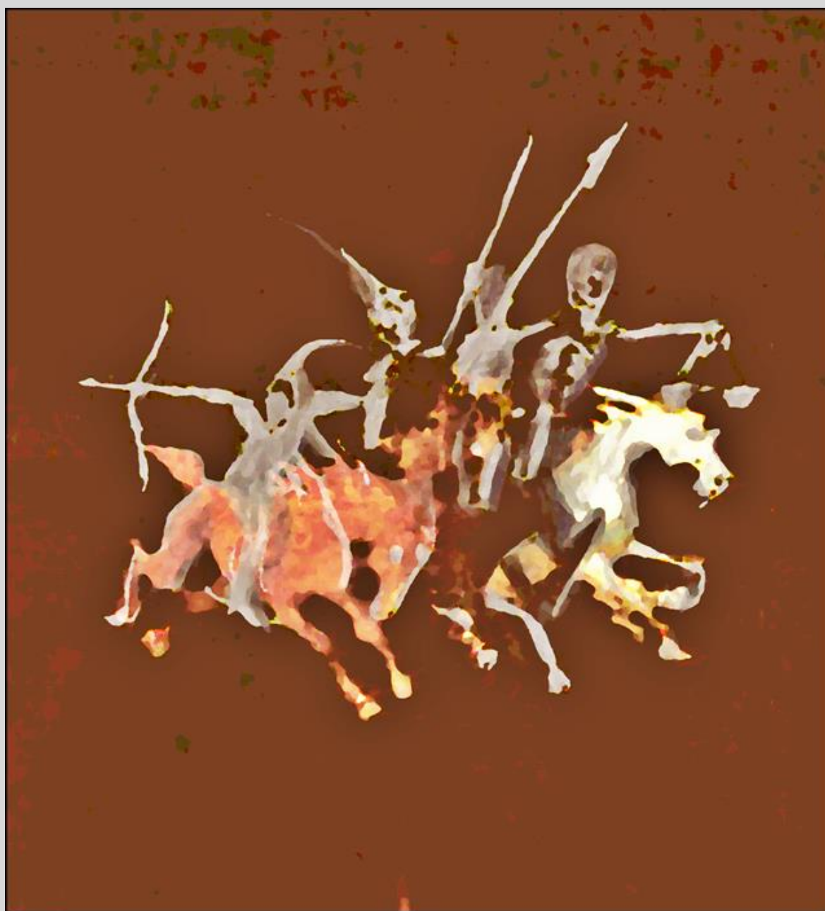
malował: mb (maj 2022)