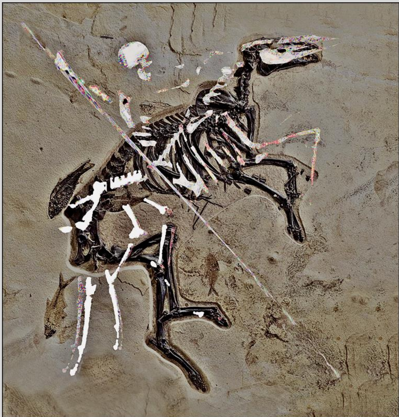
malował: mb (październik 2022)

6 I usłyszałem jakby głos w pośrodku czterech Zwierząt, mówiący: «Kwarta pszenicy za denara i trzy kwarty jęczmienia za denara, a nie krzywdź oliwy i wina!»*