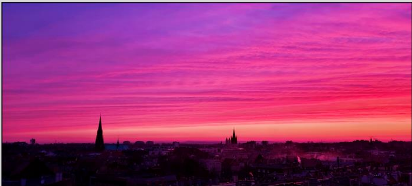
Bytom, 18.03.2022 r. g. 5:38