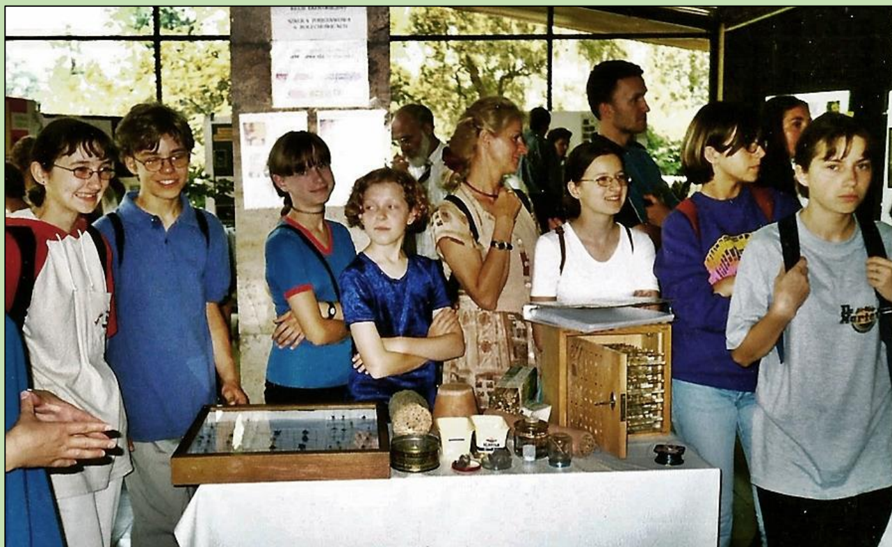
Na Wydziale Ogrodniczym Akademii Rolniczej w Krakowie Spotkanie z mieszkańcami Krakowa w ramach wystawy "Na Sześciu Nogach" Nasze stanowisko w pawilonie wystawowym