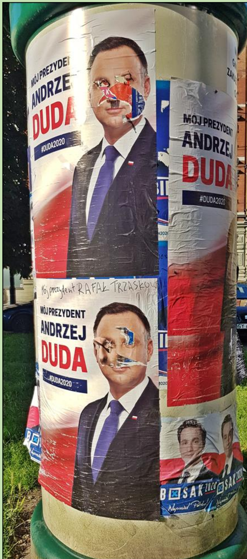
A tu próbka tego, co robiłaby opozycja, gdyby wygrała wybory...