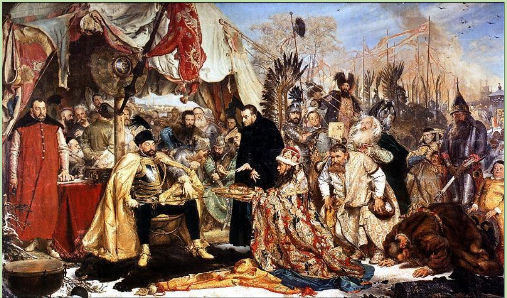
Jan Matejko, Stefan Batory pod Pskowem, obraz z 1872 [Zamek Królewski w Warszawie]