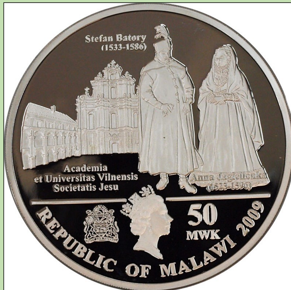
Rewers i awers okolicznościowej monety: Dzieła Jana Matejki . Republika Malawi [mennica brytyjska]