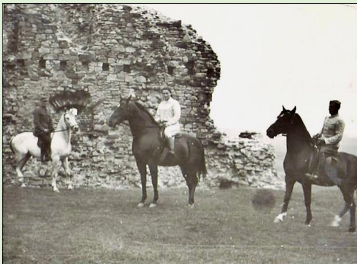
Na koniach w czasie wycieczki do Bodzentyna