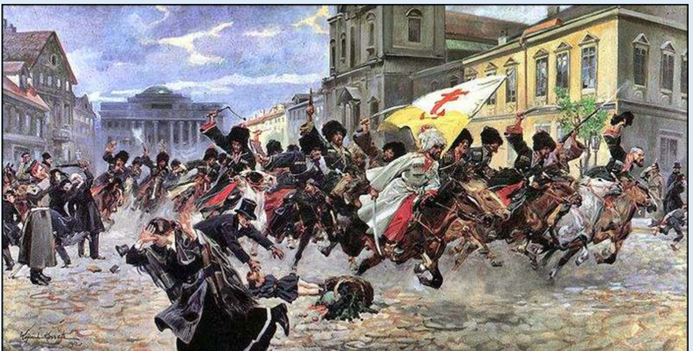
Juliusz Kossak, Czerkiesi na Krakowskim Przedmieściu , 1912 r., olej na płótnie, 100 x 200 cm