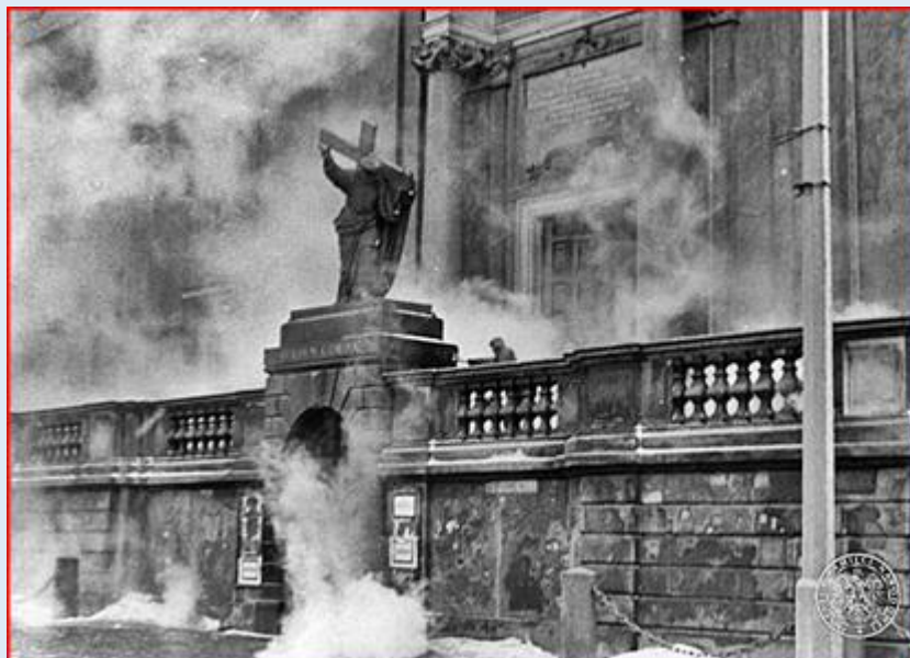
marzec 1968 r.