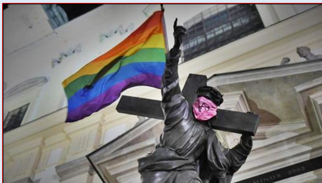
28/29 lipca 2020 r.