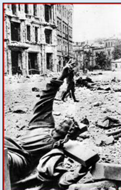
Po Powstaniu Warszawskim 1944 r.