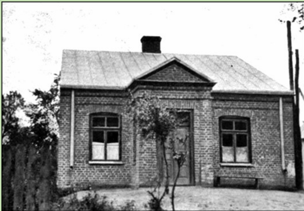
Dom murowany z 1929 r. (do s. 99)