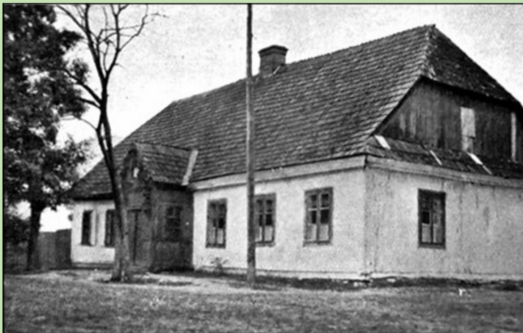
Szkoła powszechna w Przybyszewie