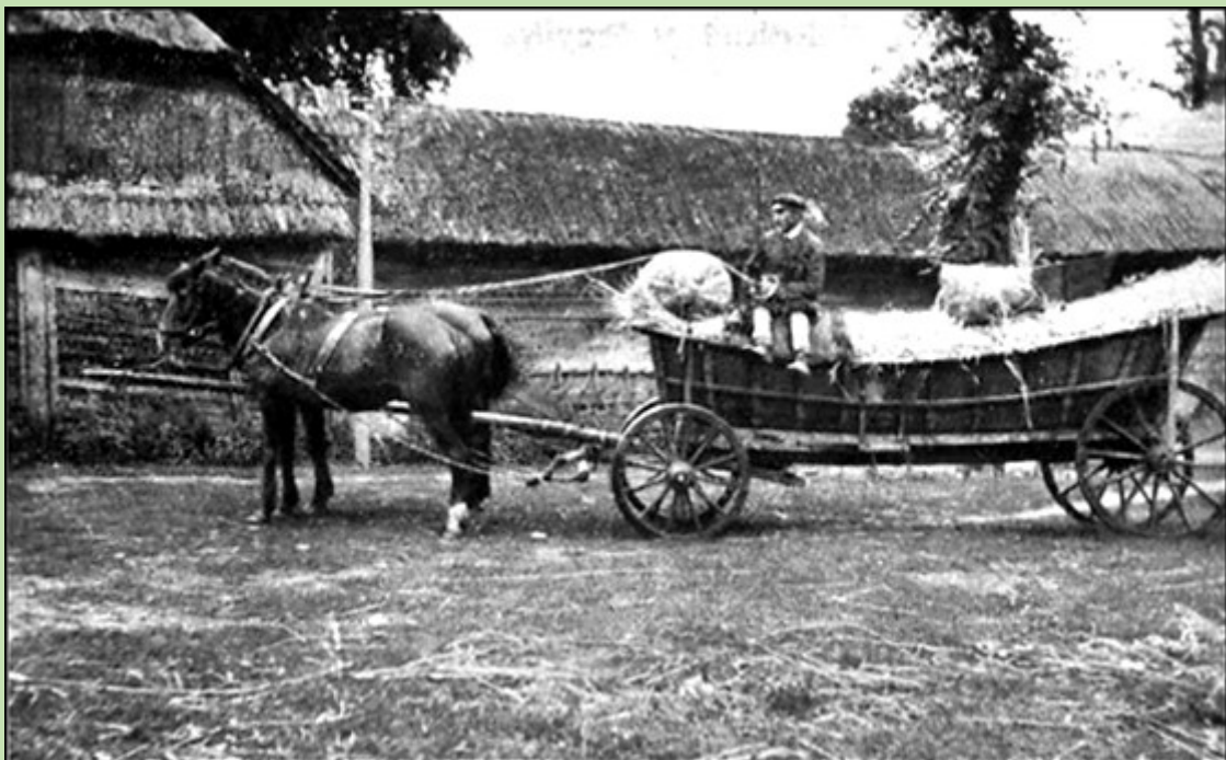
Transport ogórków do Warszawy