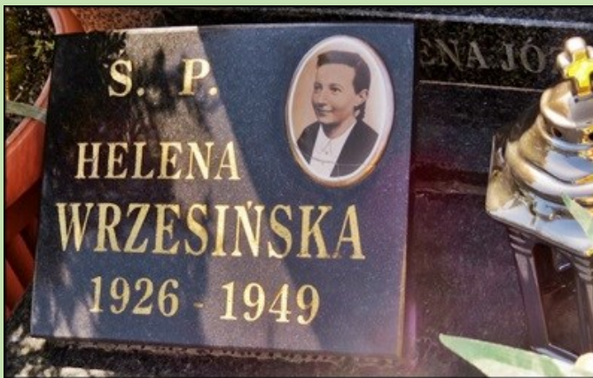
zdj. 6, 7