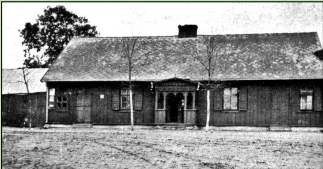
Dom typu nowoczesnego