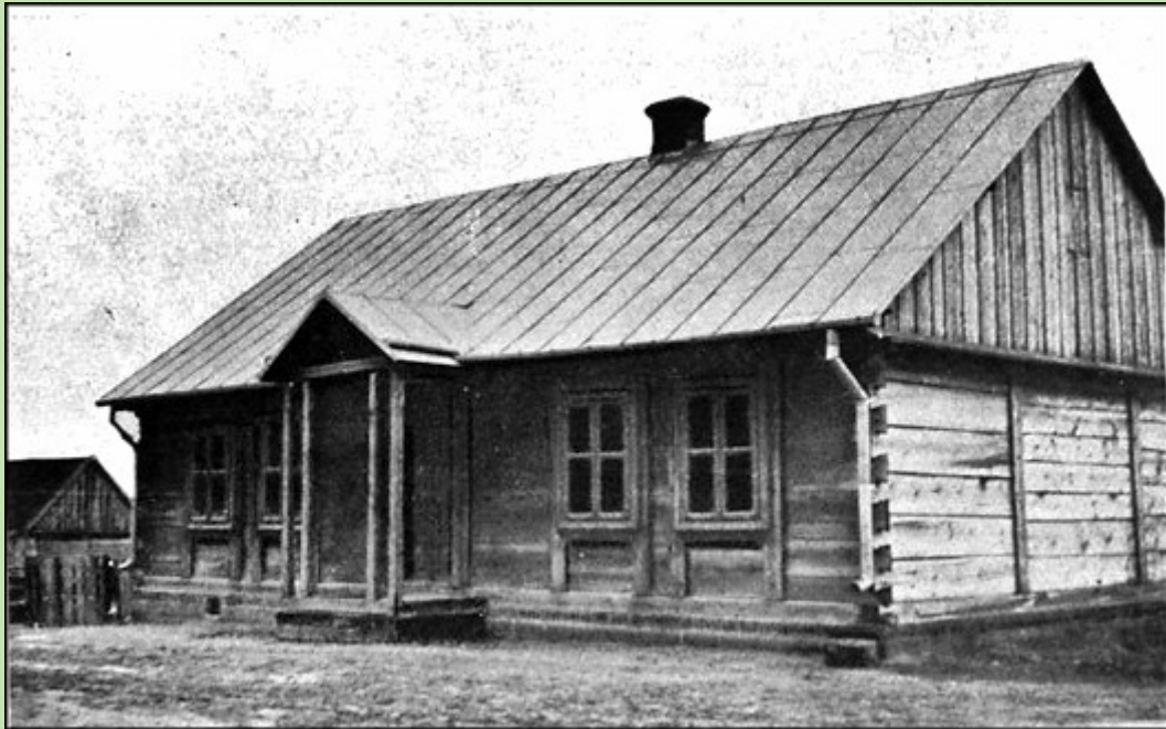
Dom drewniany z 1929 r. (do s. 97)