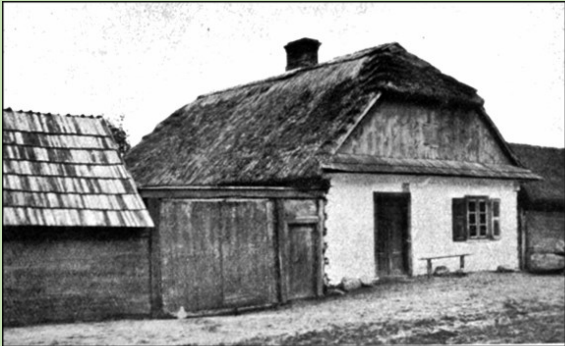
Dom typu dawnego